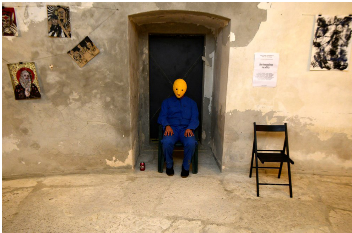
Foto 3: Darko Brajković Đepeto Njapo: Almost Human (2020).