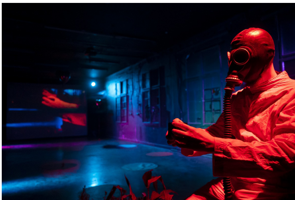
Foto 4: Robert Franciszty: Antikorona hepening ili „Ako ne mogu plesati, ne želim biti dio vaše revolucije“, FAKI, Zagreb, MEDIKA, 2020. 192