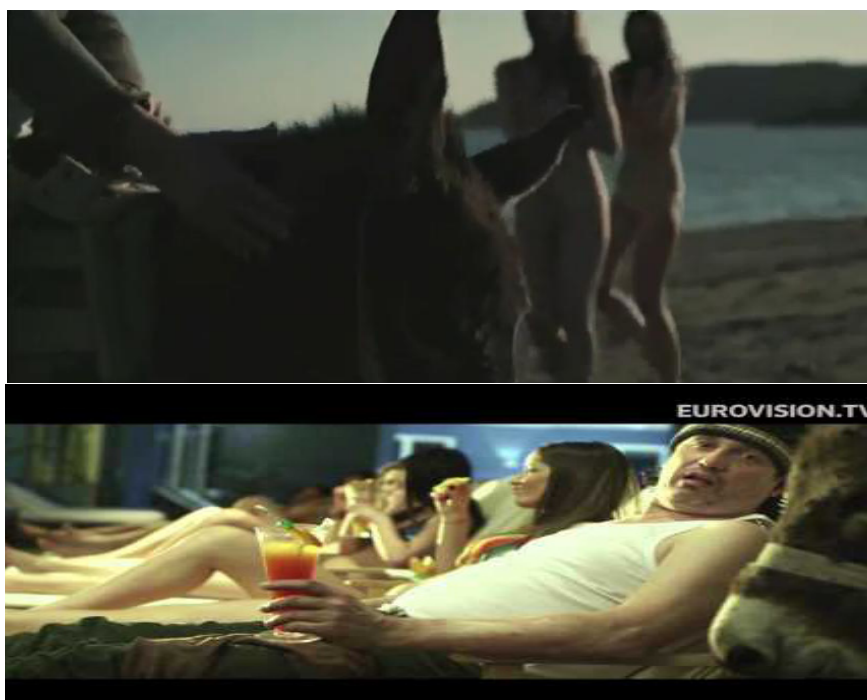
Rambo i djevojke

dolazimo do zaključka da se patrijarhat nalazi u osnovi društvenog uređenja ove zemlje. Tako je Rambo i ovdje imidž neurednog mačo muškarca, što se ogleda u njegovom „stajlingu“ – gumene čizme, bijela potkošulja, vunena kapa, neobrijan, čupav – ali i u ponašanju. U tom smislu je posebno upečatljiva scena na jahti u kojoj Amadeus, izgovarajući riječi „always be cool like a swimming pool“, prilazi bazenu u kojem se nalaze dvije djevojke i teatralno se pere u predjelu pazuha, čime potvrđuje predstavu Balkanca koji je „neciviliziran, sirov, surov i, bez izuzetka, raspojasan“ (Todorova, 2009: 14). Spot je ispunjen i predstavama mladih, mršavih i, po utvrđenim standardima ljepote, lijepih djevojaka. One su uvijek prikazane u drugom planu, kao ukras, dio pejzaža i turističke ponude Crne Gore – razgledavaju grad, ispijaju koktele u spa centru (u ovom kadru im se vide samo noge), plešu u noćnom klubu ili se gole šecu plažom. Obučene su po posljednjoj modi, prikazane kao urbane, i u skladu s europskim standardima privlačnosti, i kao takve nimalo ne zanimaju protagonista jer, čini se, ne odgovaraju tradicionalnoj predstavi majke i domaćice. 210