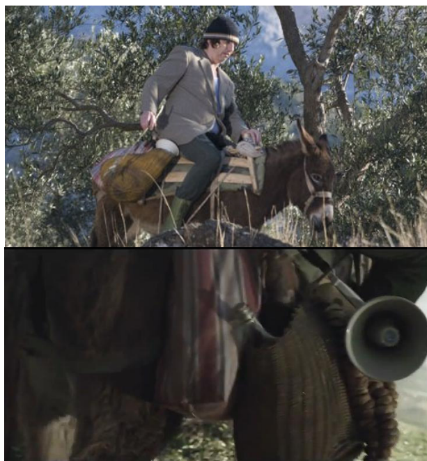
„Euro Neuro“, Rambo na magarcu i domaći proizvodi

Na ove zaključke dodatno upućuju muzika i slika. Naime, nakon zloslutnog uvoda praćenog zvukom dubokih gudača, čuje se puhački instrument koji donosi motiv egzotičnog prizvuka. Zvuci svih instrumenata korišteni u skladbama dobiveni su elektronskim putem, čime se može stvoriti asocijacija na narodne pjesme koje se na zabavama često izvode na sintesajzerima. Na taj način je, samom kvalitetom zvuka ukazano na karakteristike prodora narodnih obilježja u urbane sredine ovih prostora. Početne riječi, praćene zloslutnim smijehom i zvukom gudača u dubokom registru, „oslikane“ su prikazom Ramba kao tipičnog balkanskog muškarca, s dugom neurednom bradom i brkovima, krznenom kapom, u dugom kaputu i čizmama, raspojasanog, kako navodi Todorova. Nastavak spota prati Ramba koji na magarcu jaše kroz maslinik k moru. U kadru se u krupnom planu vide „narodna“ obilježja – šarena torba, korpa sa staklenom, vjerojatno rakijskom flašom – ali i megafon, kojim će protagonist tijekom spota najavljivati svoj dolazak. U nekoliko kratkih kadrova naznačeno je da ovaj predstavnik ruralne sredine, s planina silazi na more – u civilizaciju. Protagonist je obučen u gumene čizme, hlače, bijelu potkošulju i stari sako, a na glavi nosi vunenu kapu čime je i vizualno predstavljen kao netko tko ne pripada okruženju u koje dolazi. Na taj način je na samom početku pjesme uspostavljen identitet „nas“ koje će pjesma reprezentirati. „Mi“ smo Balkanci, divlji, necivilizirani, raspušteni, sirovi.