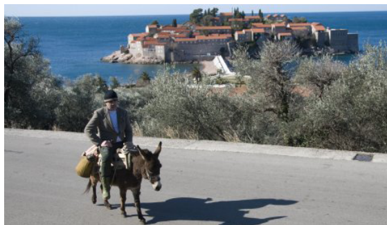
Neke od atraktivnih lokacija prikazanih u spotu

Kroz taj svijet glamura, Amadeus prolazi na magarcu i, s jedne strane nastoji, zahvaljujući strancima, zaraditi novac, a sa druge izazvati njihovo gađenje time što postoji u kontekstu u kojem ne pripada. On tako ulazi u spa centar u kojem naručuje masažu za sebe i magarca, kojeg hrani mrkvom dok