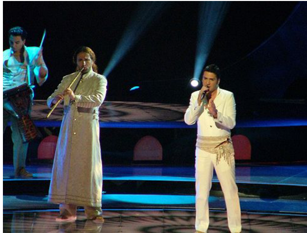
Željko Joksimović, nastup na natjecanju za pjesmu Eurovizije s pjesmom „Lane Moje“, 2004.

drugo zapadne Europe. 203 Upravo arbitrarno povezivanje Istoka i Zapada, kao i predstava „nas“ na način na koji mislimo da nas vide „oni“ (i na koji vidimo sebe?), jest i glavna odlika pjesme „Euro Neuro“.