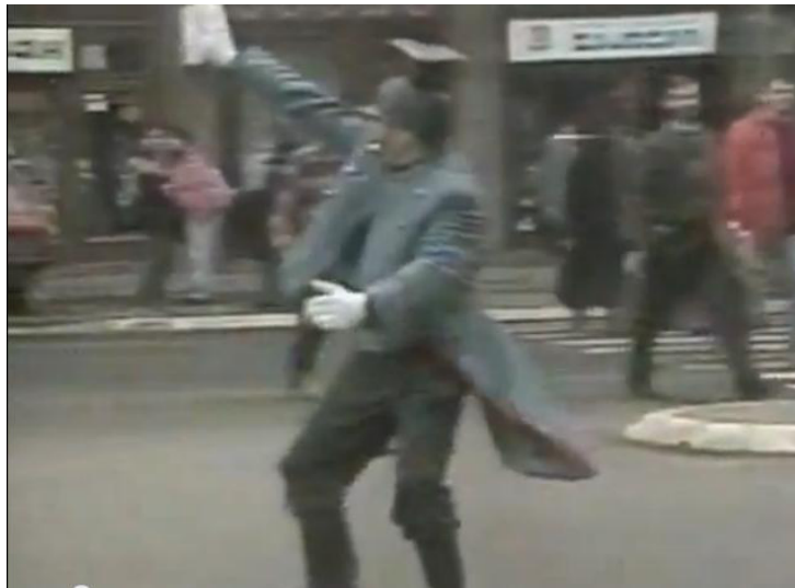
Segment spota za pjesmu „Glupi hit“

Drugi spot 197 za ovu pjesmu upućuje na iste zaključke, premda je njegova „radnja“ u potpunosti dovedena do apsurdna i ni na koji način nije povezana s tekstom. U spotu je prikazan Rambo koji, u nekoj vrsti paradne vojne uniforme šeta ulicama Beograda, zaustavlja tramvaje, „regulira“ promet, čisti cipele drugim članovima benda itd. Njime Amadeus ulazi u stvaran život svojih sugrađana, prikazujući obične ljude na ulicama, u tramvajima, radnike na gradilištima itd. Na taj način, on koncipira spot koji za cilj ima ismijati videospotove tadašnjih hitova u kojima se mahom mogu vidjeti muzičari predstavljeni u luksuznom okruženju. U njemu su slika, muzika i tekst povezani na sličan način kao i u prethodnom primjeru – jedan kadar, jedna strofa ili stih, dok su i video i muzika izgrađeni kolažnim lijepljenjem segmenata i kroz ponavljanja.