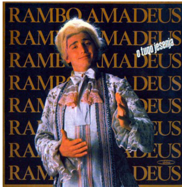
Omot albuma „O tugo jesenja“, Rambo kao Amadeus

Na pjesmama s ovog albuma (ali i u onima koje su nastale kasnije), javljaju se citati klasičnih, ali i narodnih i popularnih melodija. O tugo jesenja započinje parafrazom Straussove simfonijske poeme „Tako je govorio Zaratustra“ u pjesmi „Vanzemaljac“, za kojom slijedi naslov „Fala ti majko“ u kojoj se čuje čuveni rif iz pjesme „Smoke on the Water“ grupe Deep Purple. Ova pjesma obiluje referencama na popularne osobe kao što su Lepa Brena, Bora Đorđević, Kićo Slabinac itd. Također, pjesma „Gaudeamus“ je koncipirana kao spoj ove poznate akademske pjesme i mješovitog ritma, tipičnog za narodnu glazbu naroda Balkana, što predstavlja primjer par excellence prakse povezivanja visoke i popularne kulture. 193 Također, na ovaj način su akademska pjesma s tekstom na latinskom i ritam koji se vezuje za narodnu muziku (a ona za Balkan) postavljeni kao gotovo nespojive suprotnosti, čime se, može se reći, zvučno oslikava podijeljenost europskog kontinenta na istok i zapad.