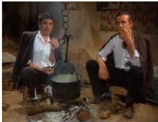
Segment spota za pjesmu „Balkan boy“

Tu je i pjesma „Balkan boy“, pjesma koja može biti neka vrsta manifesta Rambovog mačizma. U njoj Rambo repa na zvuk gusli upotpunjen matricom, dok u refrenu gusle zamjenjuje gitarski rif koji asocira na onaj iz refrena pjesme „(I can't get no) Satisfaction“ grupe Rolling Stones. Tekst refrena pjesme glasi: „Ja sam Balkan boy i smrdim na znoj i kad-tad ja biću tvoj“. Spot 194 prikazuje muzičara kako, s prijateljem sjedi pored ognjišta, sa sakoom lagodno prebačenim preko leđa, puši, i prepričava neobičan događaj koji ga je od raspojanog Balkanca „pretvorio“ u čovjeka koji se navikao na sapun i na zubnu pastu. S obzirom na to da cijeli videospot ima samo jedan kadar i nema radnju (bar u odnosu na spotove tadašnjih hitova), može se reći da Amadeus time preispituje ovaj medij i njegovu ulogu u popularnoj kulturi.