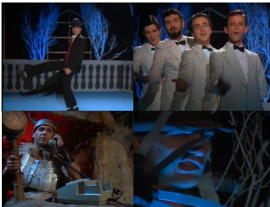
Različiti oblici klasike

Prvi 196 prikazuje Ramba koji leži u krevetu i prepričava nam „neobičan događaj“. Ova „linija radnje“ je ispresijecana kratkim kadrovima kojima se aludira na različite klasike popularne kulture. Tako, vidimo Ramba koji igra u stilu klasičnih brodvejskih predstava, četiri pjevača čija pojava i pokret predstavljaju jasnu aluzija na tzv. „barbershop“ stil, kao i prikaz muškarca obučenog u junaka iz neke sjevernjačke mitologije, u gustom krznu, s roгатom kacigom i čekićem u ruci (s obzirom na to da se na osnovi kostima ne može odrediti točno porijeklo junaka, on može izazvati čitav spektar asocijacija), kao i Ramba u ulozi Edvarda Makazića iz istoimenog filma. Odabir ovih primjera je, čini se, u potpunosti slučajan i nije u vezi sa samim tekstom, što je jedan moguć vid parodiranja videospotova ljubavnih hitova. Također, na osnovi nespretnih pokreta likova iz spota, njihovog ukočenog držanja i potpunog odsustva gracioznosti brodvejskih igrača u slučaju Rambovog plesa, jasno je ukazano na to da se radi o parodiji, a da je taj tko parodira balkanski mačo muškarac – jer pravi muškarac ne pleše graciozno, to je mahom ženska osobina.